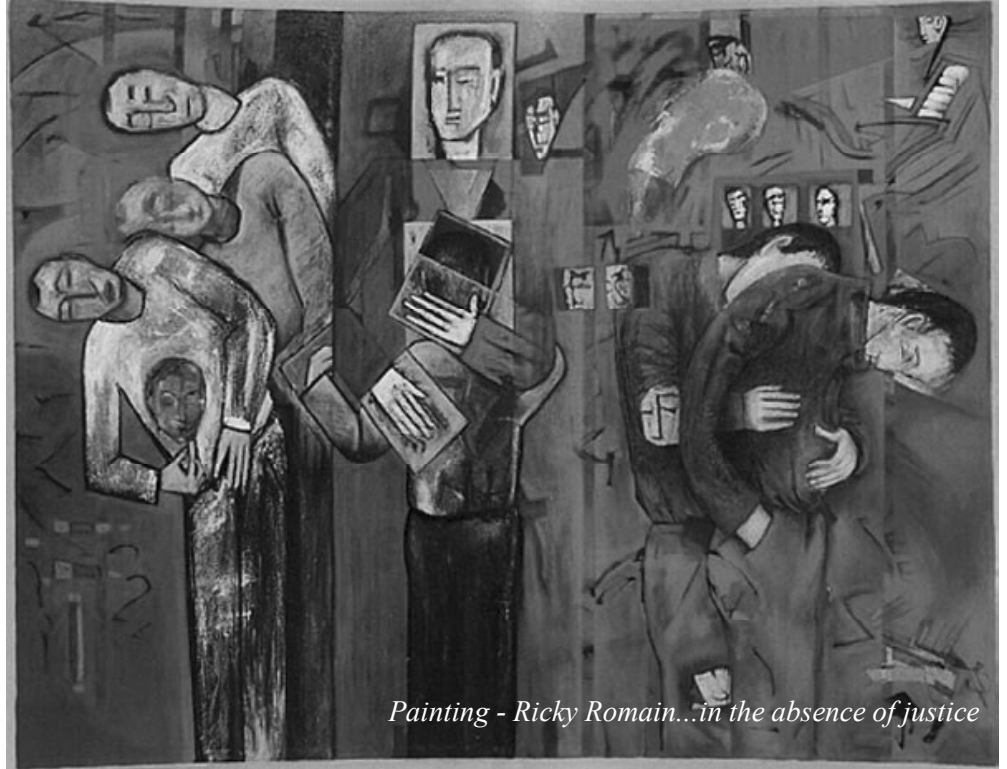
Painting - Ricky Romain...in the absence of justice

दासीशी तिच्या संमतीखेरीज शरीरसंबंध ठेवल्यास त्याला दंड करावा. तिच्याशी परक्या पुरुषाने संबंध ठेवल्यास त्याला दुप्पट दंड करावा. तिच्यावर बलात्कार केला किंवा दुसऱ्या पुरुषाला तिच्यावर बलात्कार करायला मदत केली तर तिला विकत घेण्यासाठी दिलेला पैसा तर जप्त होईलच पण तिला रोख नुकसानभरपाई द्यावी लागेल आणि नुकसानभरपाईच्या दुप्पट दंड